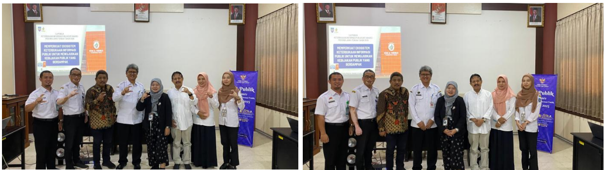
Uji Publik Oleh Panelis dan Komisi Informasi Provinsi Jawa Tengah

Selain mengikuti penilaian keterbukaan informasi publik tingkat Kabupaten Tegal, RSUD dr. Soeselo juga mengikuti monev penilaian keterbukaan informasi publik dalam kategori RSUD Kabupaten/Kota Se-Provinsi Jawa Tengah. Monev penilaian dilakukan oleh Komisi Informasi Provinsi Jawa Tengah dengan melalui 4 tahapan yang sama, yaitu Tahap 1 Penilaian Kelengkapan Dokumen Website dan Media Sosial, Tahap 2 Monev Penilaian SAQ, Tahap Ke 3 Penilaian Visitasi dan Verifikasi Dokumen, Tahap Ke 4 Uji Publik Tingkat Provinsi Jawa Tengah