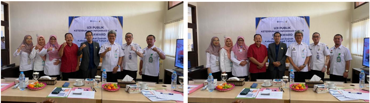
Uji Publik Oleh PPID Utama Dinas Komunikasi dan Informatika Kabupaten Tegal

Berdasarkan hasil rapat Tim penilai KIP Award Kabupaten Tegal Tahun 2025 terdiri dari tahap I penilaian Website PPID Pelaksana, Tahap II Kuesioner Penilaian Mandiri atau Self Assessment Questionnaire (SAQ), Tahap III Verifikasi dan Visitasi bagi Badan Publik Perangkat Daerah yang dinyatakan lolos Tahap III Verifikasi Visitasi selanjutnya berhak mengikuti tahapan pemeringkatan Presentasi Uji Publik Badan Publik Perangkat Daerah Tahun 2025. Penilaian Uji Publik akan menjadi dasar penetapan Pemeringkatan Badan Publik Perangkat Daerah Tahun 2025. Dalam penilaian Tahap III Verifikasi dan Visitasi, 16 Badan Publik Perangkat Daerah Kabupaten dan 1 Perangkat Daerah Kecamatan ditetapkan lolos tahap IV Uji Publik. Proses Uji Publik Perangkat Daerah yang dilakukan akan menjadi dasar Pemeringkatan dalam penilaian Keterbukaan Informasi Publik (KIP) Award Bagi Badan Publik Perangkat Daerah yang dinilai telah melaksanakan layanan Keterbukaan Informasi Publik dengan baik dalam melaksanakan Keterbukaan informasi selaku Badan Publik di lingkungan Pemerintah Kabupaten Tegal.