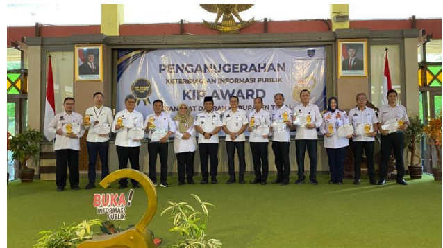
Penganugerahan Keterbukaan Informasi Publik oleh Bupati Tegal