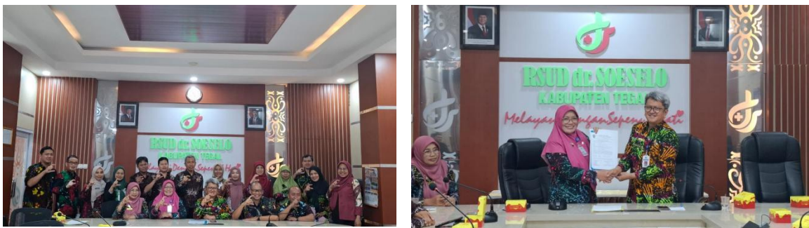
Visitasi & Verifikasi Oleh PPID Utama Dinas Komunikasi dan Informatika Kabupaten Tegal

Badan Publik RSUD dr. Soeselo Kabupaten Tegal masuk ke dalam kategori badan publik yang lolos untuk mengikuti kegiatan visitasi dan verifikasi.