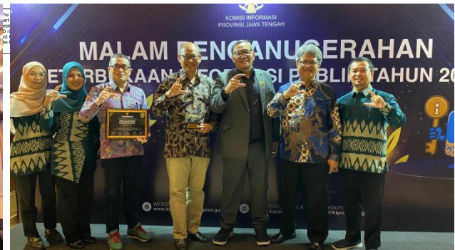
Penganugerahan Keterbukaan Informasi Publik oleh Komisi Informasi Provinsi Jawa Tengah