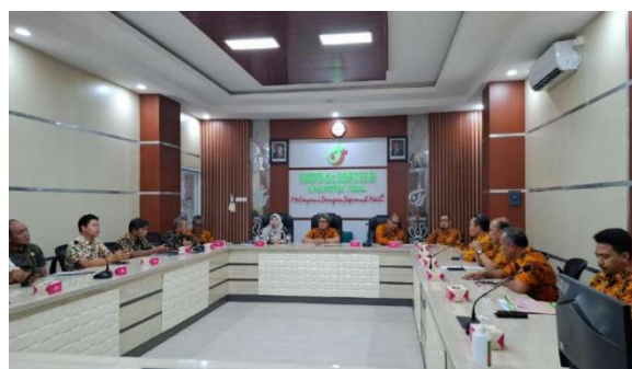
Rapat Penyusunan DIP & DIK Tahun 2025