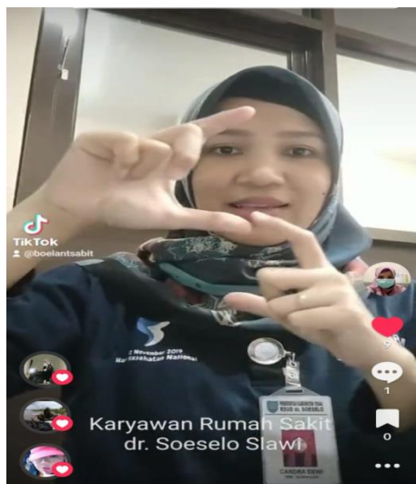
Petugas Penerjemah bahasa isyarat (Bisindo)