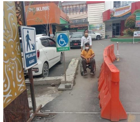
Jalur khusus disabilitas