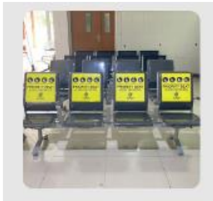
Kursi tunggu khusus disabilitas