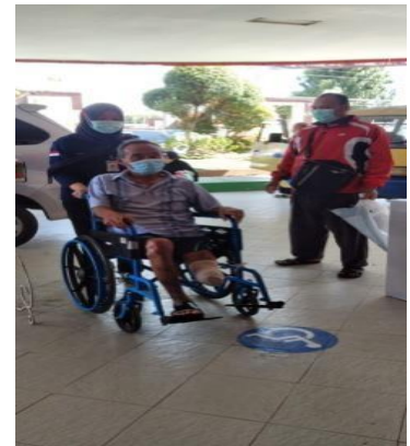
Petugas Khusus disabilitas