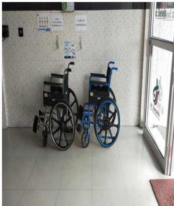
Fasilitas kursi roda