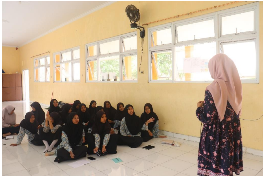
Sosialisasi Bullying di SMA Luqman Al-Hakim Kabupaten Tegal