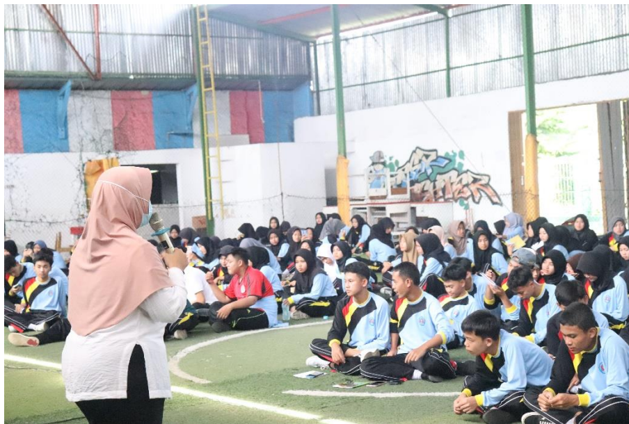
Sosialisasi Bullying di SMA Negeri 1 Bojong Kabupaten Tegal