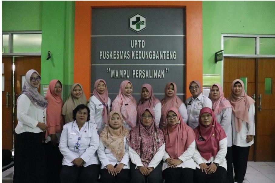
Pembinaan Jejaring Rujukan di Puskesmas Kedungbanteng Kabupaten Tegal