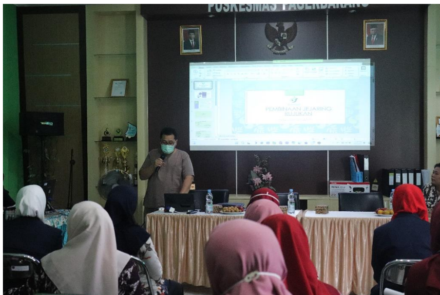
Pembinaan Jejaring Rujukan di Puskesmas Pagerbarang Kabupaten Tegal