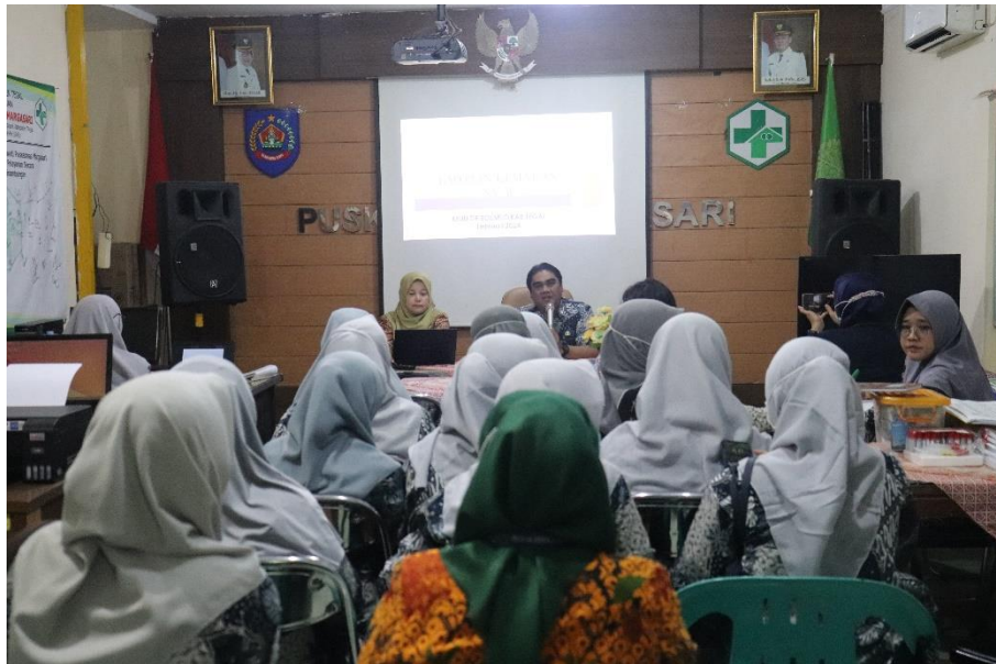
Pembinaan Jejaring Rujukan di Puskesmas Margasari Kabupaten Tegal