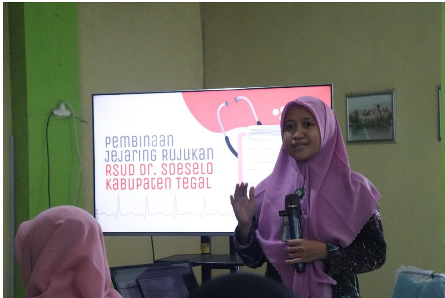
Pembinaan Jejaring Rujukan di Puskesmas Jatinegara Kabupaten Tegal